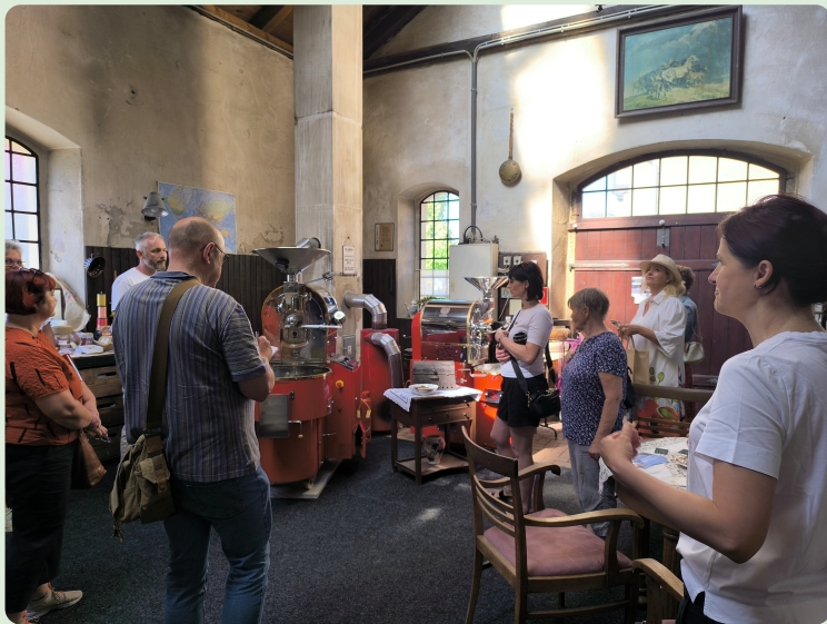
"Kaffeerösterei am Rosengarten" in Milkel

Hier erfahren Sie Neuigkeiten rund um die Oberlausitzer Heide- und Teichlandschaft!