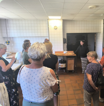
Bäckerei Trittmacher, Malschwitz